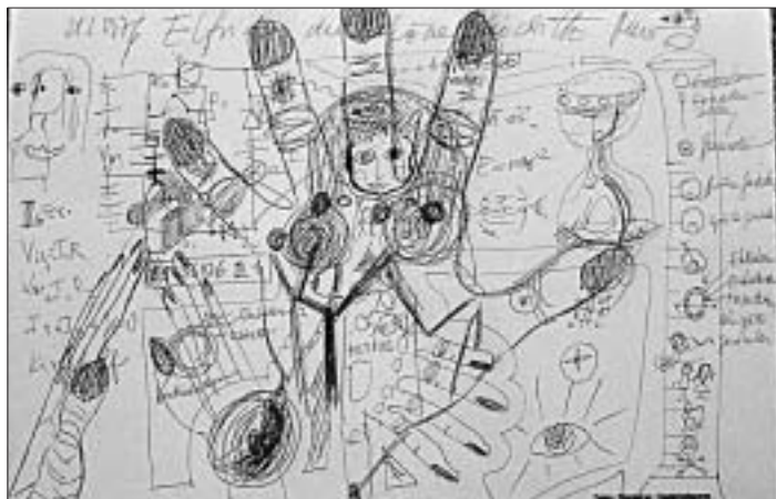
Wenn im Kopf alles durcheinander geraten ist.