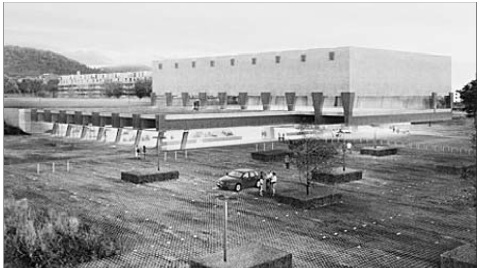
Projekt Sporthalle Weissenstein.

Um die Zusammenarbeit zu verbessern, haben wir seit einiger Zeit ein zweimal jährlich stattfindendes Treffen der Kommissionspräsidenten mit den Generalsekretären der Direktionen der Stadtverwaltung. Dies hat bereits Verbesserungen ergeben, da wir länger im Voraus informiert sind, was für Vorhaben anstehen. Zudem wurden in einer internen Publikation der Stadtverwaltung alle Quartierkommissionen mit ihren Schwerpunkten vorgestellt, dies in der Hoffnung, dadurch einen besseren Be-