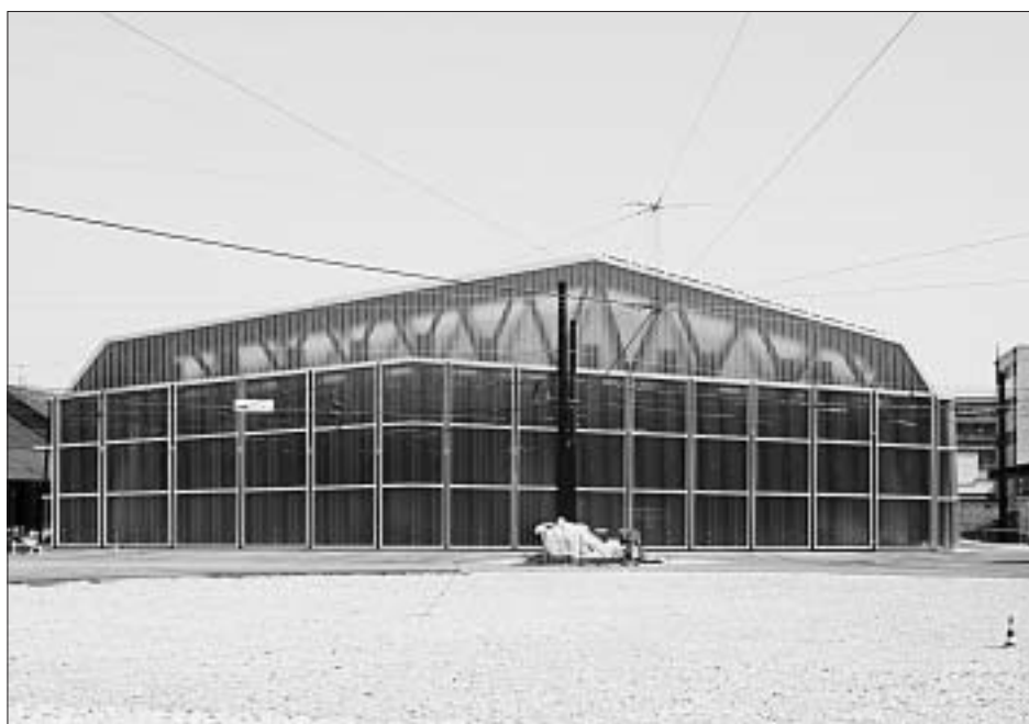
Das neue Tramdepot.