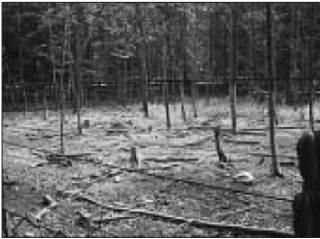
Wisente nutzen den Wald intensiv.

Die Wisentanlage trägt sehr zur Zufriedenheit der Gäste des Tierparks bei. Dies lässt sich leicht an der deutlich verlängerten Auf-