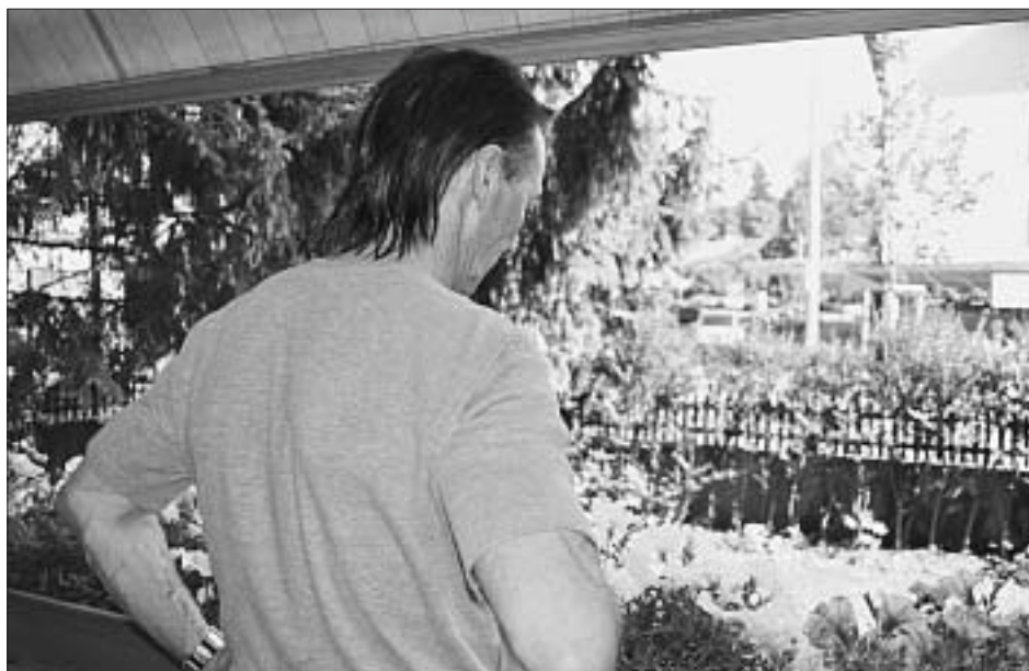
F.B. hat Glück, seine Strafe nicht «änet em Hag» bzw. hinter schwedischen Gardinen verbüssen zu müssen. Hier auf seinem Balkon in einem Berner Aussenquartier.

EM als Alternative zum Strafvollzug ist eine gute Sache. Meine Freunde und mein Arbeitgeber wissen alle davon. Ich bin froh, daheim bleiben zu dürfen und nicht mit anderen Gefangenen den Tag verbringen zu müssen. Mit EM wird man auch nicht aus der Gesellschaft he-