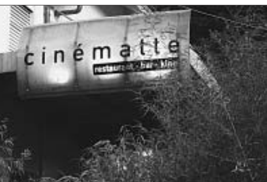
Die Cinématte: Restaurant, Kino und Bar in Einem.

Mit der Gründung des Kulturvereins Cinématte im Jahr 2000 entstand an der Wasser-