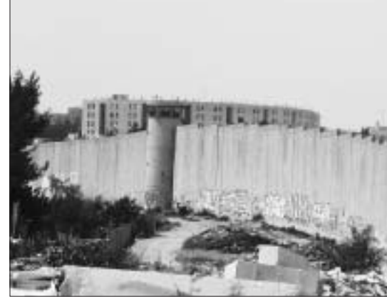
Blick von Bethlehem nach Har Homa.

Die Menschen in Bethlehem reagieren unterschiedlich darauf, dass ihre Stadt von Mauer und israelischen Siedlungen praktisch eingeschlossen ist: In einigen Dörfern rund um die Stadt finden – wie in zahlreichen Dörfern des Westjordanlandes – wöchentliche Demonstrationen statt. Dabei wird vor allem dagegen protestiert, dass die lokalen Bauern grosse Flächen ihres Agrarlandes verloren haben, da es auf der anderen Seite der Mauer liegt und sie nicht mehr dorthin gelangen können. Ein anderer Bewohner Bethlehems zieht schwarzen Humor vor: Er schnitzt und verkauft die für Bethlehem typischen Holzkrippen für Weihnachten. Auf seiner Variante der Krippe können die drei heiligen Könige das neugeborene Jesuskind jedoch nicht erreichen, da sich zwischen ihnen die Mauer erhebt.