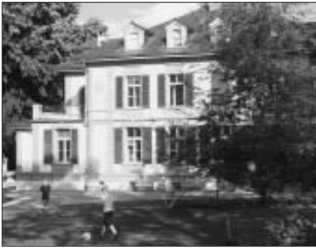
Die Villa Stucki an einem frühen Abend.

Die letzten Sonnenstrahlen des Tages beleuchten die Villa Stucki, der Garten liegt jedoch im Schatten der umliegenden Bäume. Auf dem Rasen vor dem Haus spielen ein paar Jungs Fussball. Schon bald erfüllt der Geruch von Gewürzen die Luft. Wie üblich an einem Dienstagabend, denn dann wird äthiopisches Essen serviert. Noch ist es zu früh für Gäste, weshalb sich einige der Köchinnen und Köche hinter der