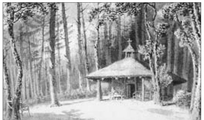
Ermitage im Elfenaupark, Bern, um 1820.