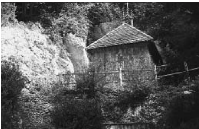
Waldbruder-Klause in der Ermitage Arlesheim.

EMOTIONEN, Katalog zur Ausstellung, Bernisches Historisches Museum, 1992, S. 84