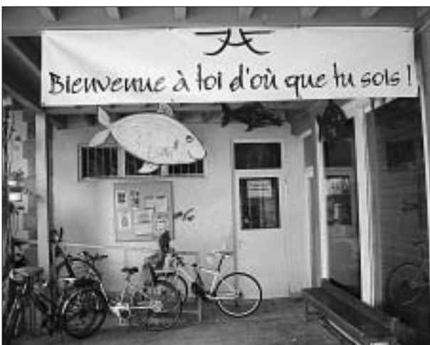
Maison de Quartier des Eaux-Vives.